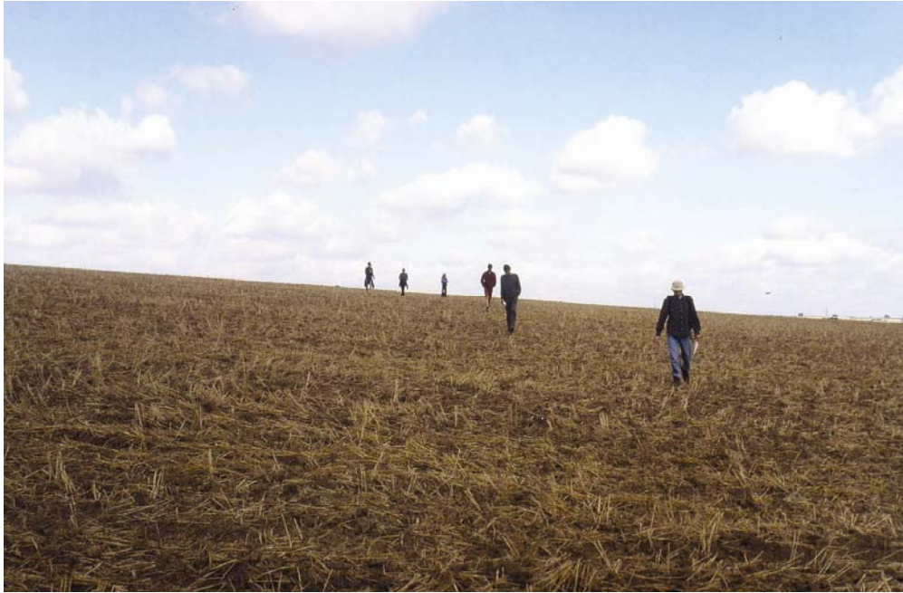
Abb. 1: Einzelbetriebliche Naturschutzberatung – Ideen für Maßnahmen auf dem Betrieb

Ursachen für die allgemeine Intensivierungstendenz in der Landnutzung bei gleichzeitiger Nutzungsaufgabe auf unrentablen Flächen liegen in ökonomischen Zwängen und der Nachfrage nach gleich bleibend billigen Nahrungsmitteln. Zudem stellt sich die Frage nach der Wertschätzung für die durch Landwirtschaft produzierbaren „Naturgüter“, nach dem Interesse von Landwirten an Naturschutzziele und nach der Motivation, verstärkt Naturschutzziele bei der Bewirtschaftung bewusst einzubeziehen (Abb. 1).