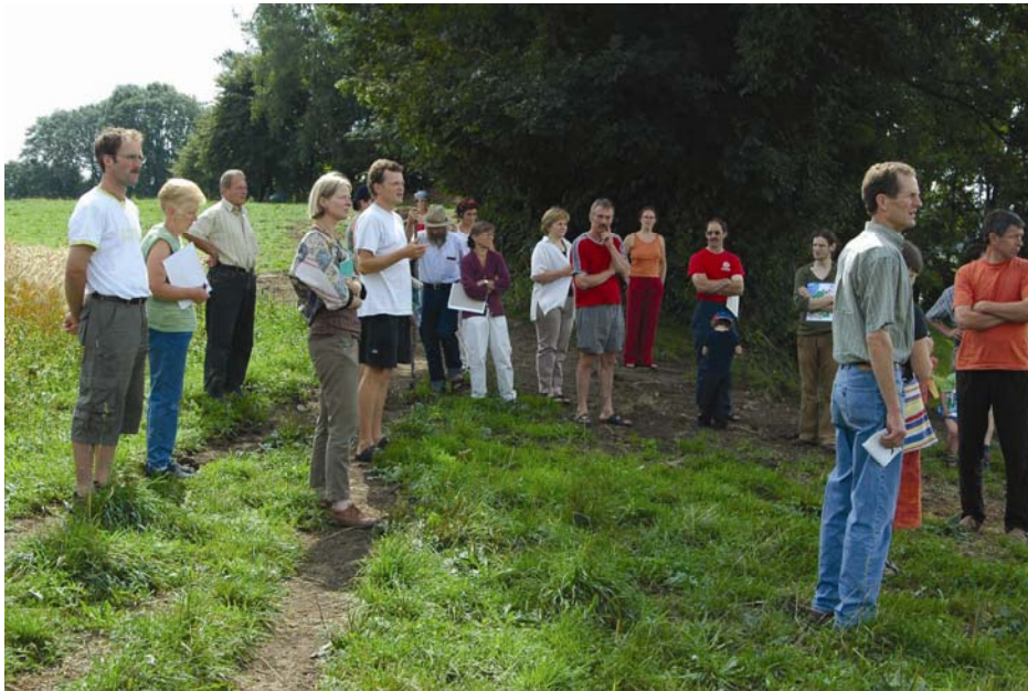
Abb. 5: PETRARCA-Landschaftsseminar auf dem Schoderhof bei Ravensburg

Die anspruchsvollste Variante einer partizipativen Naturschutzberatung ist, den Ideenfindungsprozess selber in den Mittelpunkt zu stellen. Im Normalfall werden bei einer Beratung verschiedenste Vorstellungen – was ist vom Betrieb her machbar, was ist naturschutzfachlich wünschenswert – zum Ergebnis konkreter Maßnahmen führen. Bereits die Frage, was denn naturschutzfachlich wünschenswert sei, differenziert sich je nach „Leitart“ oder „Gebietskulisse“, die man durch Maßnahmen fördern möchte. Welche Tierarten werden durch die Pflanzung einer Hecke gefördert, welche zurückgedrängt? Welche Maßnahme ist die richtige für die jeweilige Landschaft? Wie werde ich hier urteilsfähig?