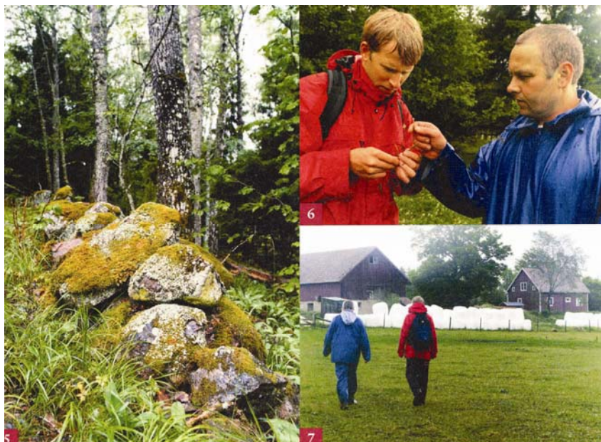
Abb. 2: Aus einem schwedischen Prospekt zur einzelbetrieblichen Naturschutzberatung